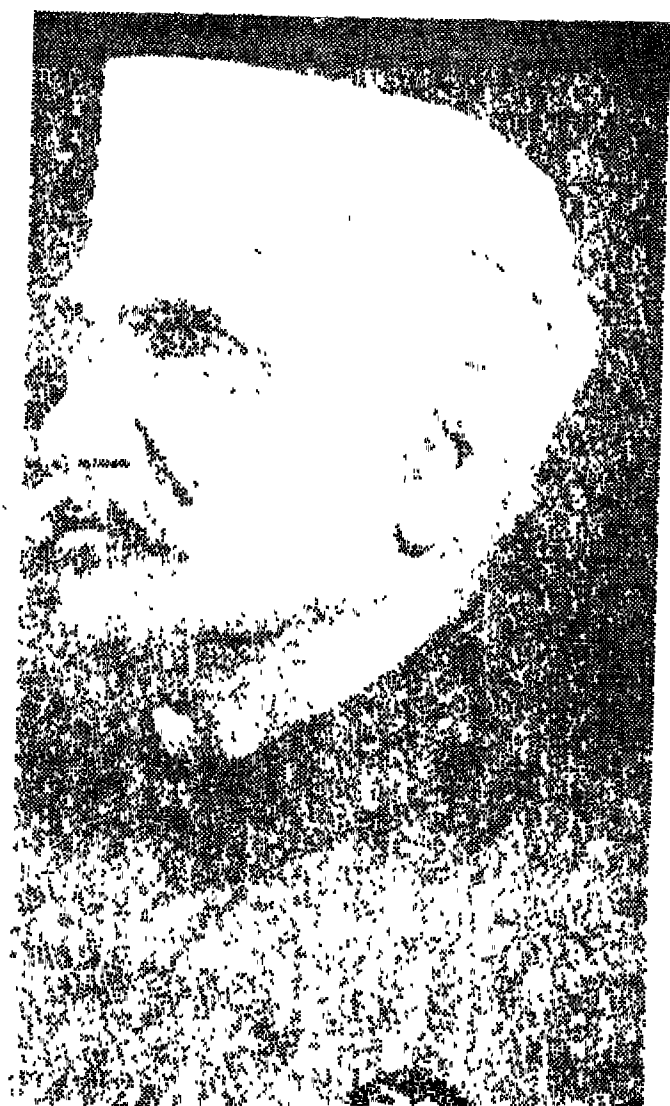
आचार्य नरेन्द्र देव